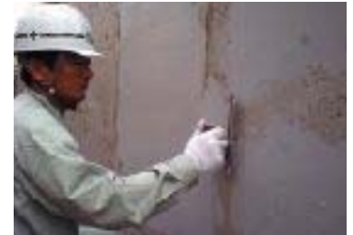
リフレベースWパテ塗布状況