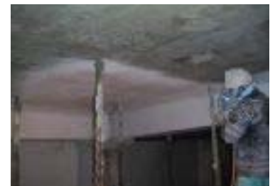
リフレベースW塗布状況 (リシンガン吹付け施工)