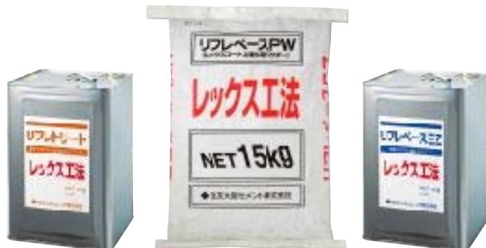
荷姿は製造の都合等により予告無く変更する場合がありますので予めご了承下さい。

レックスコート1000は優れた防水性、遮塩性及び中性化抑止性を有する無機質系高弾性被覆材で、コンクリートに有害な雨水や炭酸ガス、塩化物イオンの進入を防ぐコンクリート保護塗材です。